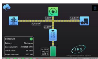
EMS能源管理系統(選購)